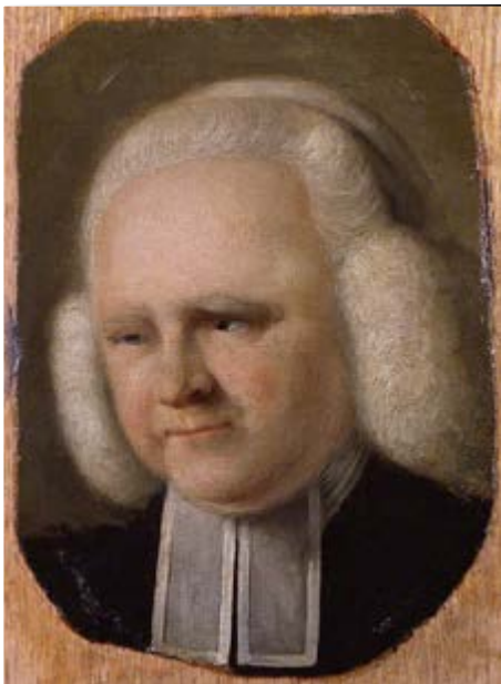
George Whitefield gan John Russell. Olew ar gynfas a osodwyd ar fwrdd, c.1770

Clerigwr Anglicanaidd, o Gaerloyw yn wreiddiol, y taniodd ei bregethu teithiol fudiadau adnewyddol efengylaidd a Phrotestanaidd yn Lloegr, Cymru, yr Alban, Iwerddon a phob un o dair trefedigaeth ar ddeg America, oedd Whitefield.