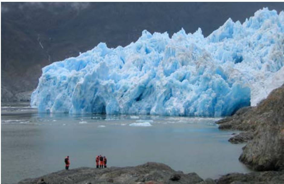
Rhewlif San Rafael ym Mhatagonia