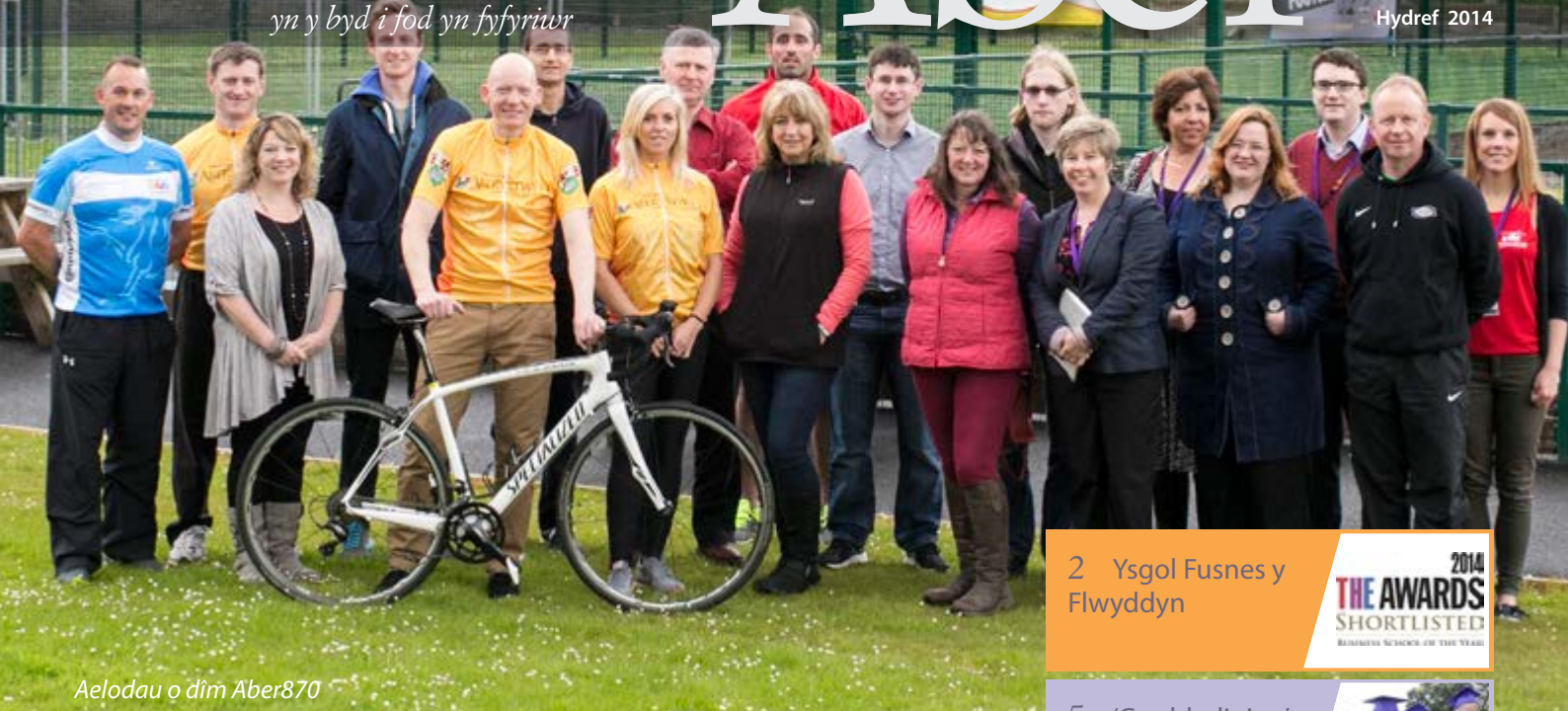
Aelodau o dim Aber870