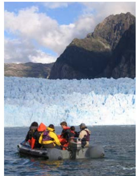
Rhewlif San Rafael ym Mhatagonia