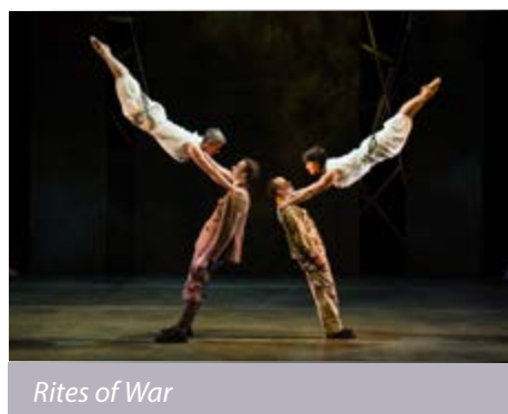
Rites of War